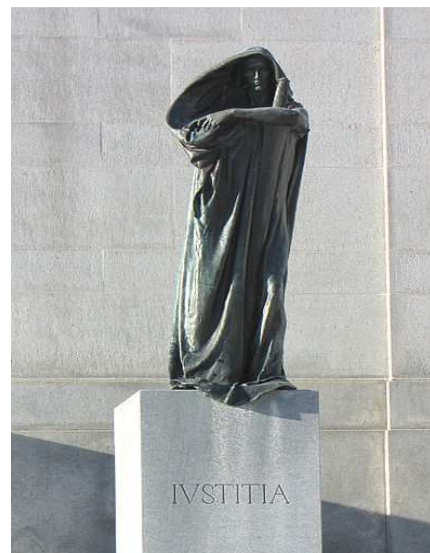
Justitia: Corte Suprema de Justicia Ottawa