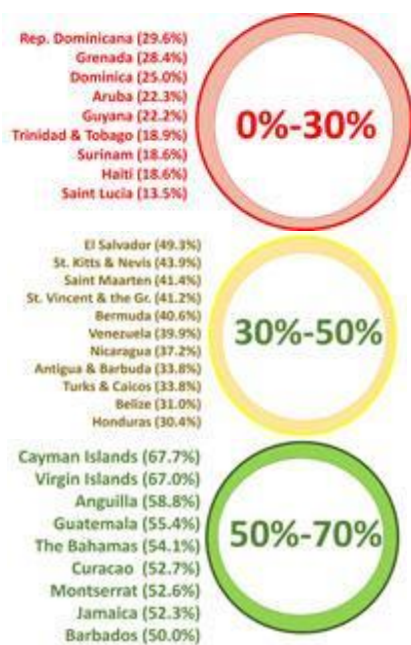
Figura X: Cumplimiento de las Recomendaciones del GAFI (%) al cierre de su Tercera Ronda de Evaluaciones Mutuas en 2013

Se debe enfatizar que el GAFIC tiene, entre sus miembros, Centros de Excelencia de los cuales se podrían extraer conocimientos y experiencias y compartirlos intra-organizacionalmente, y que podrían ser emulados por todos los Miembros.